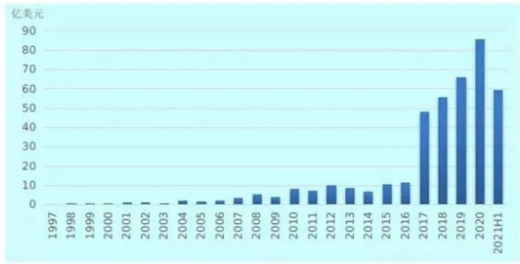
1997—2021 年上半年我国知识产权使用费跨境收入情况